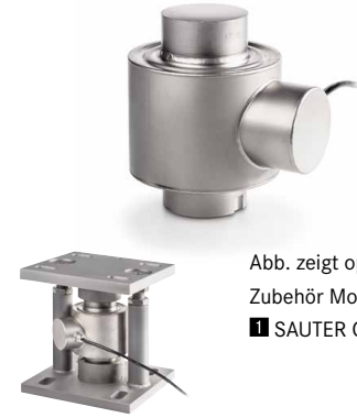
Abb. zeigt optionales Zubehör Montagekit ■ SAUTER CE P41430